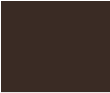
Grey brown - No. 10 RAL 8019